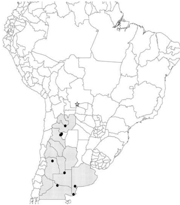
Figura 2. Mapa de distribución de Eudinopus dytiscoides . El color resaltado muestra las provincias

Este registro se constituye en el primero para Bolivia considerando la lista de escarabajos peloterios elaborada por Hamel et al. (2006); así mismo incrementa su distribución E. dytiscoides en 494 km en línea recta hacia el norte desde Jujuy, Argentina (Fig. 2), área ubicada dentro de la zona del Gran Chaco. En la zona estudiada, es de actividad completamente diurna y aparentemente tiene mayor preferencia al excremento fresco (reciente).