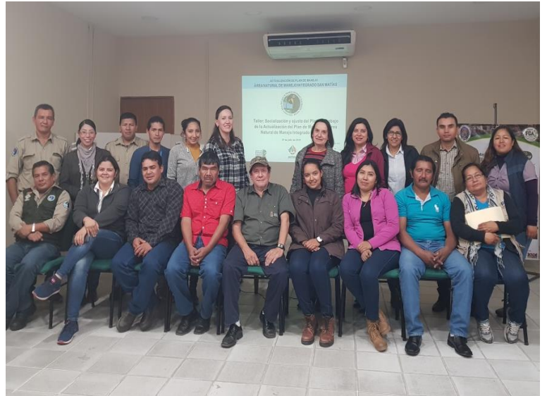
Comité impulsor y Equipo técnico del proceso de actualización del plan de manejo.

El Área Natural de Manejo Integrado San Matías es la segunda área protegida con mayor extensión territorial de Bolivia (2.918.500 ha). El Museo NKM, con fondos de la WWF-Bolivia, realiza el proceso de actualización del plan de manejo con el objetivo de fortalecer la gestión del área protegida y su articulación a las visiones de planificación de los gobiernos municipales de su área de influencia. Los avances realizados son la conformación del comité impulsor del proceso, la realización del diagnóstico integral y la socialización del mismo al comité impulsor. En el componente de biodiversidad se tienen nuevos registros para el área protegida, departamento y probablemente una nueva especie para el país.