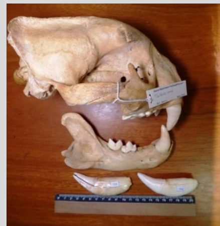
Caninos numerados de varias especies y comparación de caninos de jaguar con un cráneo de la colección científica.

Por el número y posición de los caninos de cada especie se sabe que al menos se mataron 30 jaguares, 29 pumas y 4 ocelotes para obtener estos dientes, más los 3 ciervos, un pejichi y un pecarí. Las pieles eran de jaguar y una estaba recientemente curtida al cromo como se hace localmente. Las cornamentas eran de ciervo de los pantanos, y una aún unida al cráneo tenía olor a formol por su reciente tratamiento de conservación. Un abrigo confeccionado con unas 8 pieles de ocelote. Las 11 estatuillas blancas eran de marfil de elefante, de origen africano o asiático. Otras conclusiones biológicas tuvieron que ser postergadas al devolver la evidencia a la corte.