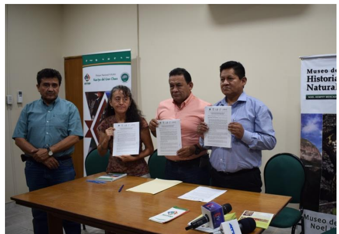
Firma de convenio entre el Museo NKM y el SERNAP.