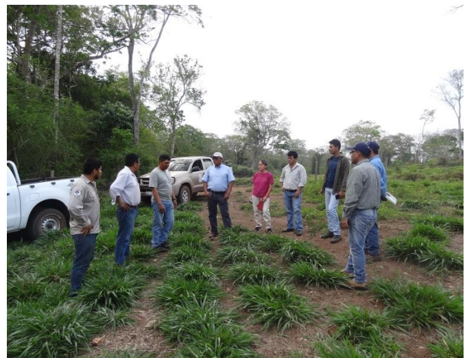
Viaje de campo a Alta Vista, Concepción en el marco del convenio con la FCBC.

conjuntas destinadas a la conservación de la diversidad biológica y el desarrollo local en las áreas protegidas de interés nacional. Así, los convenios son un valioso instrumento para fortalecer las relaciones entre las instituciones y establecer mecanismos de cooperación que permitan el desarrollo de las instituciones firmantes.