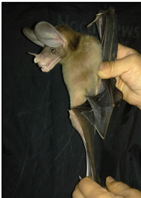
Figura 2. Especimen hembra de Vampyrum spectrum (MNKM-5369) colectado en la Propiedad Agrícola Palmas Reales

El 25 de octubre de 2016 durante un muestreo de la murciélagos del área de estudio se colectó un espécimen (hembra) de Vampyrum spectrum en una de las redes de niebla (12 x 3 m) instalada en el extremo Oeste de la propiedad, en un espacio habilitado para el ganado (Figura 2) (18°04'57.6"S y 62°39'21.2"O; 313 m.). Las redes permanecieron activas entre las 19:00 y las 01:00 horas, siendo revisadas cada 30 minutos y haciendo un esfuerzo de muestreo de 72 horas/red. La colecta se produjo a las 22:08 Hrs., la dirección que seguía el individuo era de Este a Oeste y volaba a una altura aproximada de 1.5 m. En el mismo sitio se registraron otras especies de murciélagos como ser: Desmodus rotundus , Molossus , Noctilio albiventris y Molossops temminckii .