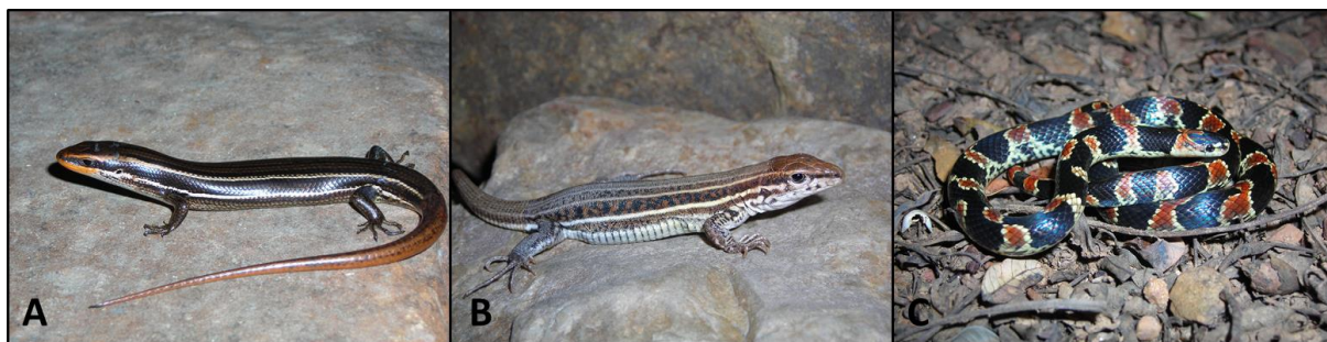
Figura 3. Ejemplar adulto de Aspronema cochabambae (A); Contomastix vittata (B); y Atractus cf. bocki (C).

Por otro lado, se identificaron cuatro especies importantes para la conservación: Aspronema cochabambae (Figura 3A), Contomastix vittata (Figura 3B), Atractus cf. bocki (Figura 3C) y Micrurus serranus ; todas ellas reptiles que se encuentran bajo la categoría Vulnerables según el libro rojo de la fauna silvestre de vertebrados de Bolivia; además, tres de ellas también son endémicas (*) de los Bosques Secos Interandinos en Bolivia (Cortez, 2009) (Tabla 1) y hasta el año 2009, A. bocki también era considerada endémica del país (Aguayo & Passos, 2009), posteriormente la especie ha sido registrada para la Argentina (Passos et al. , 2009). Por otra parte C. vittata está categorizada como especie En Peligro Crítico según la IUCN (Embert, 2010), por lo cual existe la necesidad de incrementar los esfuerzos de investigación y conservación de esta especie en particular.