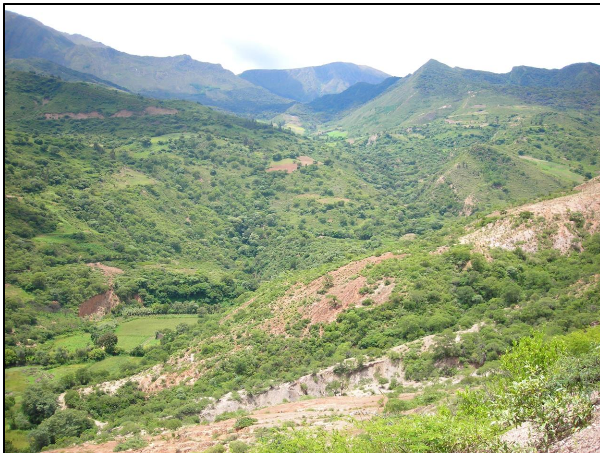
Figura 2. Paisaje de los Bosques Secos Interandinos de Pojo y sus alrededores. Figure 2. Landscape of Interandean Dry Forests of Pojo and its surroundings.