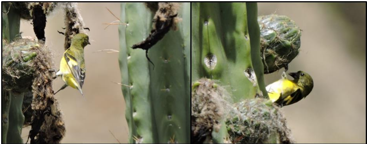
Figura 3. Una hembra de Spinus xanthogastrus , forrajeando en frutos de cactus ( Trichocereus bridgesii ).

Aves frugívoras son consumidoras de frutos de cactus en diferentes zonas de los Neotrópicos (Soriano et al. , 1999), por ejemplo, Saltator aurantirostris (Cardinalidae) ha sido observado consumiendo frutos del cactus Corryocactus melanotrichus (Larrea-Alcázar & López, 2008). Similarmente Diuca diuca consume insistentemente frutos de Echinopsis atacamensis en el Parque Nacional Cardones, Salta (Argentina) y aparentemente también Sicalis raimondii siempre se lo ve en cactus (N. Krabbe, com. pers.), pero el conocimiento sobre la dieta del género Sicalis es poco conocida.