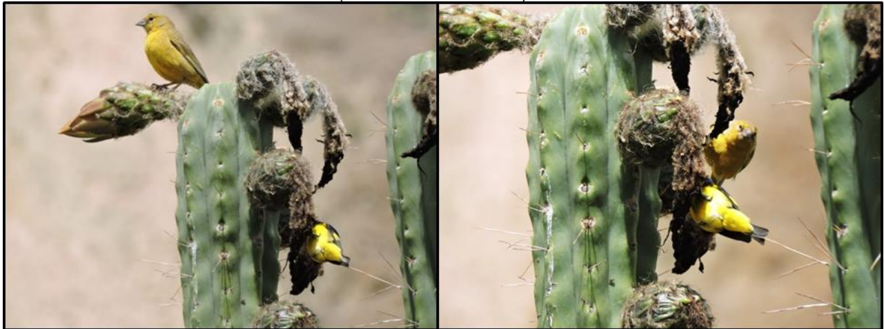
Figura 5. Dos especies simpátricas de jilgueros, forrajeando simultáneamente en frutos de cactus.