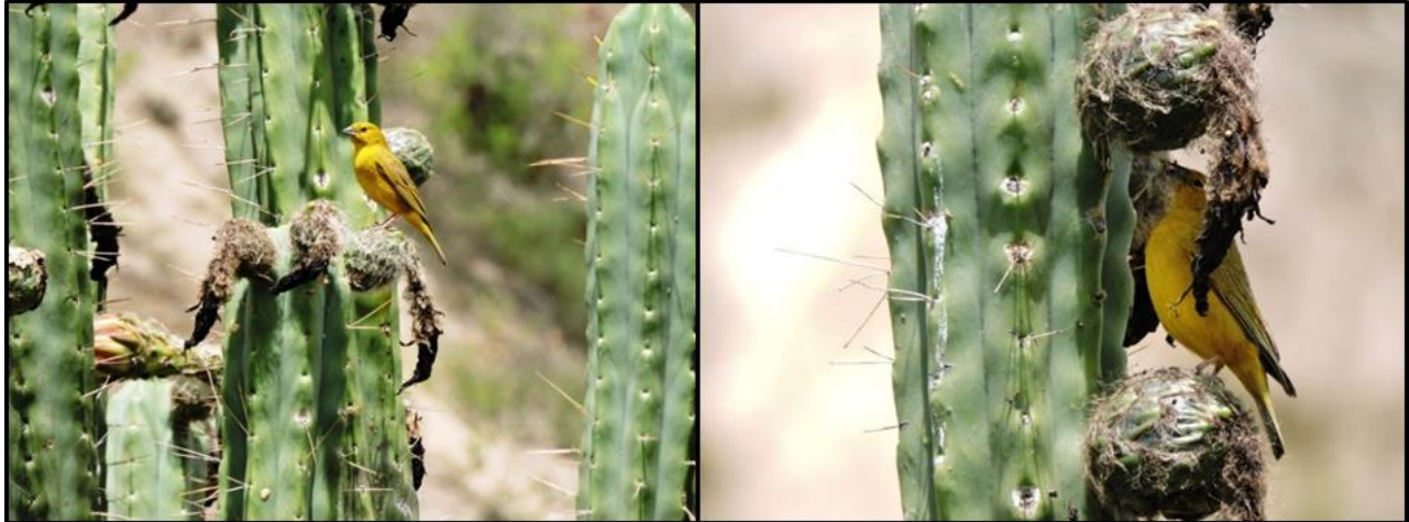
Figura 4. El Jilguero Puneño ( Sicalis lutea ), consumiendo frutos de cactus ( Trichocereus bridgesii ).