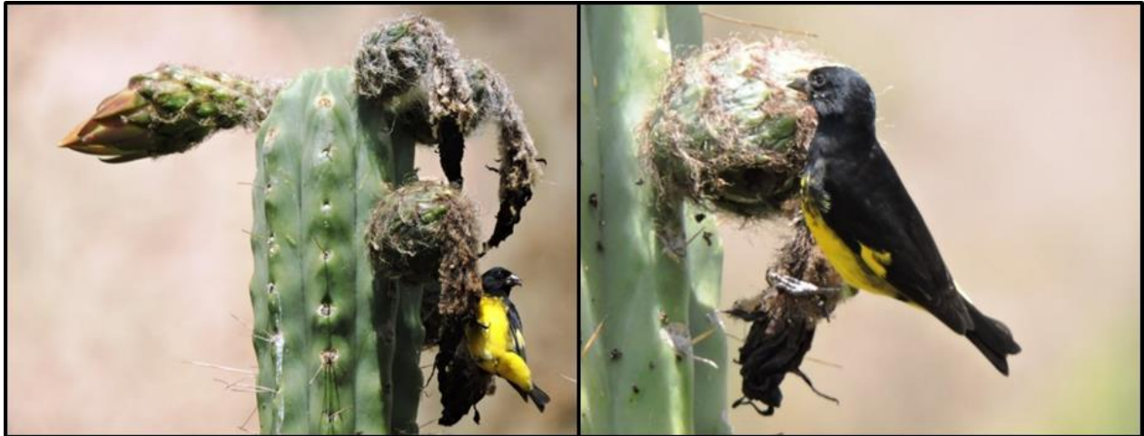
Figura 2. Dos aspectos de un macho de Spinus xanthogastrus forrajeando en frutos de cactus ( Trichocereus bridgesii ).

mostraba dominante desplazando a S. xanthogastrus . Ambas especies de aves, consumen semillas del fruto de la cactácea, horadando con el pico, la pulpa de los frutos, principalmente en la parte basal del mismo, sin llegar a consumir el fruto en su totalidad, pero también forrajean en cactus, aparentemente para consumir insectos, principalmente hormigas que suelen frecuentar estas plantas.