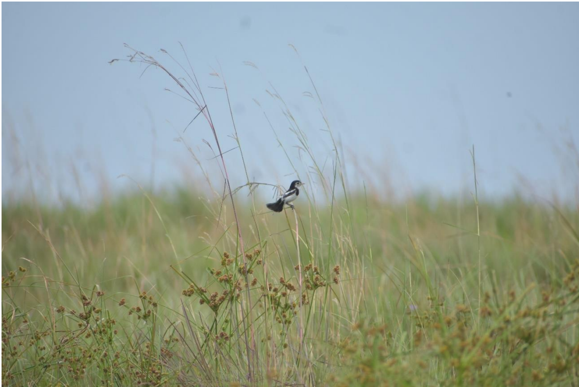
Figura 2. Macho adulto de A. tricolor registrado en la Estancia Algarrobo (14-XII-2023).

Dado el bajo número de registros, no fue posible aplicar métodos de estimación de abundancia, densidad ni análisis de ocupación estadísticamente robustos. Estos resultados reflejan una muy baja detectabilidad de la especie en los sitios estudiados y/o una posible reducción drástica de sus poblaciones en esta región.