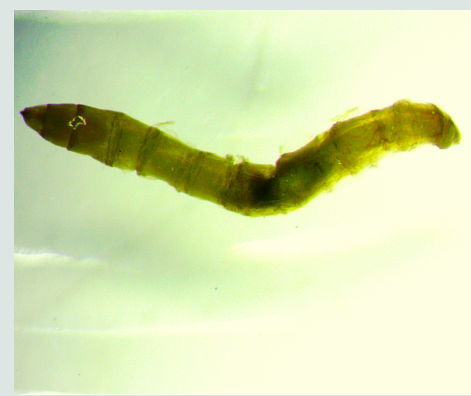
9 Familia Tabanidae