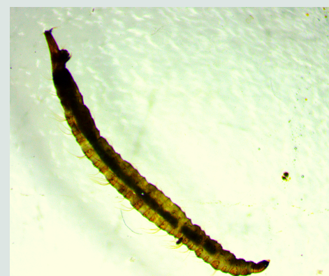
6 Familia Psychodidae