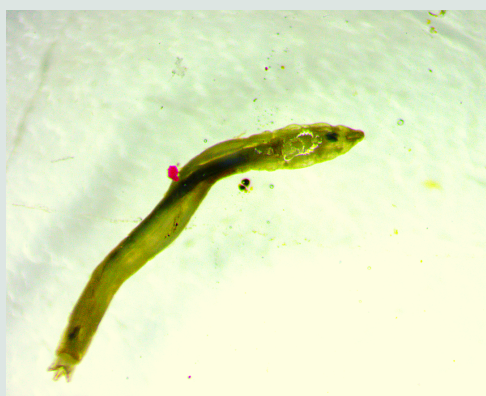
5 Familia Tipulidae