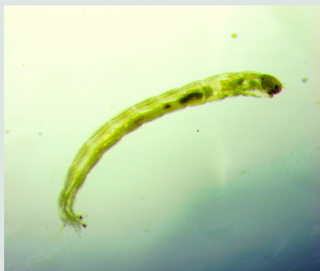
1 Familia Chironomidae

Autores: Mervin Saavedra y Shirley Tola Museo de Historia Natural Noel Kempff Mercado - UAGRM Mayo 2021, Santa Cruz - Bolivia