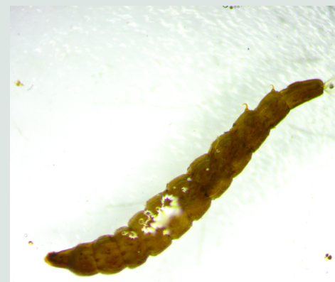
3 Familia Stratiomyidae Foto ST y MS