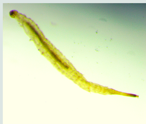
7 Familia Ptychopteridae