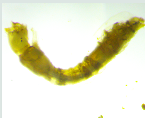
8 Familia Simuliidae