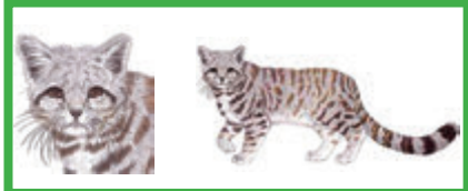
Gato andino ( L. jacobita ) 4-8 kg, cola gruesa con anillos anchos, hocico negro