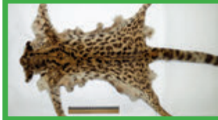
Tilcayo, oncilla ( L. tigrinus ) 1-3 kg con rosetas no alineadas y pelo largo