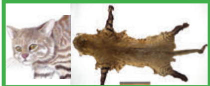
Gato de pajonal ( L. colocolo ) 3-7 kg, manchas variables, cola fina, patas con anillos oscuros, nariz rosada