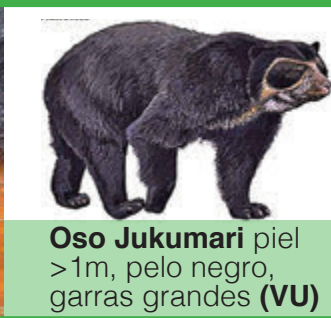
Oso Jukumari piel >1m, pelo negro, garras grandes (VU)