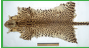
Gato montés ( Leopardus geoffroyi ) 2-5 kg, pintas simples, cola anillada