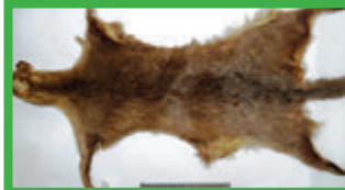
Gato gris ( Puma yagouaroundi ) 3-8 kg, sin pintas, gris o pardo rojizo