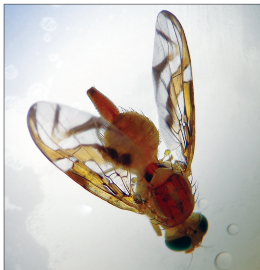
Mosca de la fruta del género Anastrepha recuperada de fruto. Fotografía de Elizabeth Quisberth, 2013.

Anastrepha spp. conocida también como la mosca sudamericana de la fruta, especie nativa de amplia distribución en la región neotropical. El género Ceratitis ha logrado proliferar en las zonas donde hay disponibilidad de frutos susceptibles a su ataque, distribuyéndose de esta manera en casi todo el territorio boliviano y mostrando una alta capacidad de adaptación a las diversas condiciones climáticas. El género Anastrepha mantiene limitada su distribución en las regiones con clima tropical y subtropical. Ambas especies de tefrítidos causan pérdidas significativas a la fruticultura y son una de las principales limitaciones para la expansión y comercialización de frutos (Quisberth, 2005). Actualmente, las moscas de la fruta se constituyen en una de las plagas de mayor trascendencia en el país, de restricción cuarentenaria más importante para el comercio hortofrutícola internacional y uno de los factores de mayor pérdida en la producción de frutales y hortalizas con un promedio de pérdida que puede variar entre 20 y 60%. Se hace importante la implementación de una estrategia de control que permita reducir estos márgenes de pérdidas y acceder a los mercados internacionales (PROMOSCA, 2009).