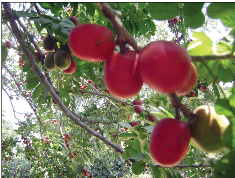
Frutos de ciruelo brasileiro ( S. purpurea ).