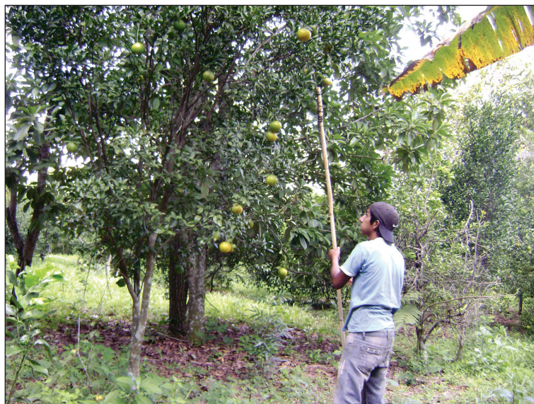
Obtención de muestras de frutos de la planta.