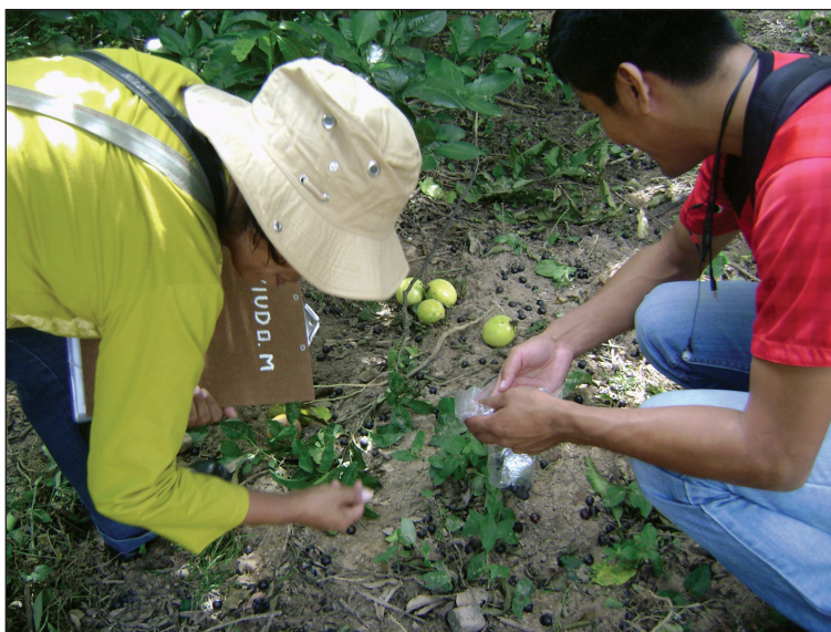
Investigadores coleccionando frutos del suelo.

El tiempo de exposición del fruto en el campo proporciona mayor chance de parasitismo para las diferentes especies, tanto para las que parasitan en diferentes niveles de desarrollo de los frutos, como para las que parasitan diferentes fases de desarrollo de mosca hospedera. Salles (1996) al coleccionar frutos de los árboles obtuvo especies de parasitoides de la familia Braconidae ( Doryctobracon spp. y O. bellus ) y al coleccionar frutos del suelo, además de braconidos, también obtuvo especies de Pteromalidae ( P. vindemmiae ) y Figitidae ( Odontosema sp). Purcell et al. (1994) al coleccionar frutos de guayaba de las plantas obtuvieron mayor número de parasitoides de huevos ( F. arisanus ) y de los frutos coleccionados del suelo obtuvieron mayor número de parasitoides de larvas ( D. longicaudata ). Con esto queda demostrado que cuanto menor sea el tiempo de exposición de los frutos en campo, menor será el chance de parasitismo.