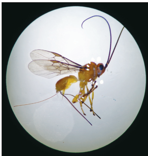
Parasitoides nativo Hymenoptera: Braconidae.

Los agentes de control biológico más importantes y los más utilizados para el control de las moscas de la fruta son los parasitoides de la familia Braconidae. Como ya se dijo, estos parasitoides son pequeñas avispas de coloración generalmente castaña, alas transparentes y con un constrictión entre el abdomen y el tórax (Paranhos et al. , 2009). Los braconidos son endoparasitoides cenobiontes (no interfieren en el desarrollo inicial del hospedero), que ovipositan en los huevos o larvas de tefrítidos y los adultos del parasitoides emergen de la pupa del hospedero (Wharton y Yoder, 2011). Los parasitoides pasan por un ciclo biológico típico que comprende las fases de huevo, larva, pupa y adulto. En los parasitoides el número de estadios es variable y depende de la especie (Ovruski, 1994).