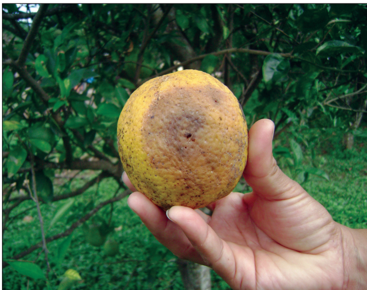
Naranja var. Valencia tardía, con síntoma típico de mosca de la fruta.

presencia de las plagas en la fruticultura, entre las que destacan las moscas de la fruta (Diptera: Tephritidae) frugívoros que pueden constituirse en factores limitantes para la producción y comercialización de frutas para el consumo en fresco y procesados.