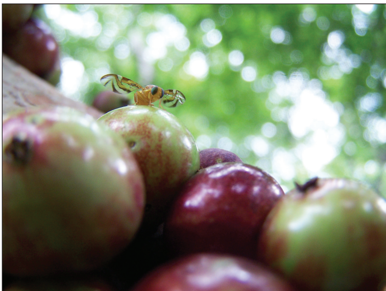
Mosca de la fruta ( Anastrepha sp.) ovopositando en frutos de guapurú ( Myrciaria cauliflora ).