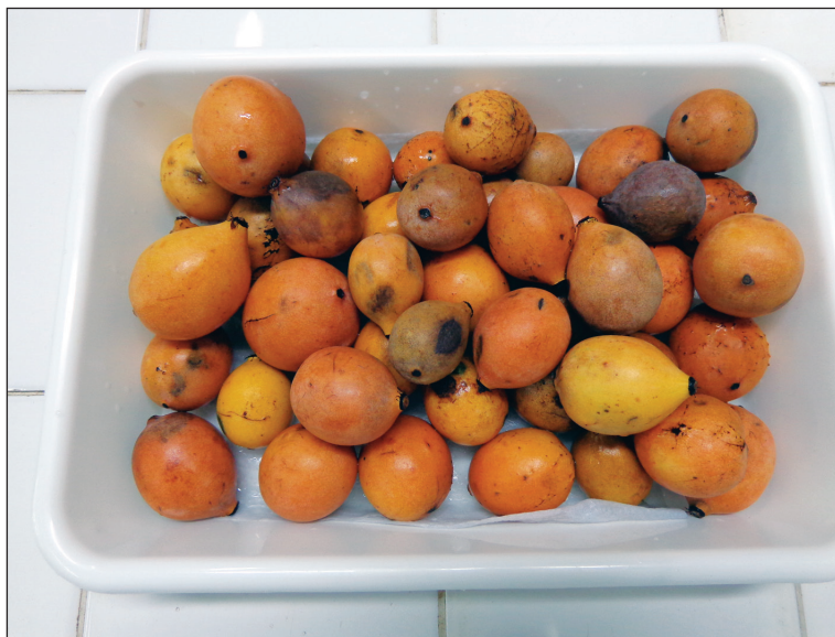
Lavado y desinfección de frutos de achachairú.

Fotografía de Elizabeth Quisberth, 2012.