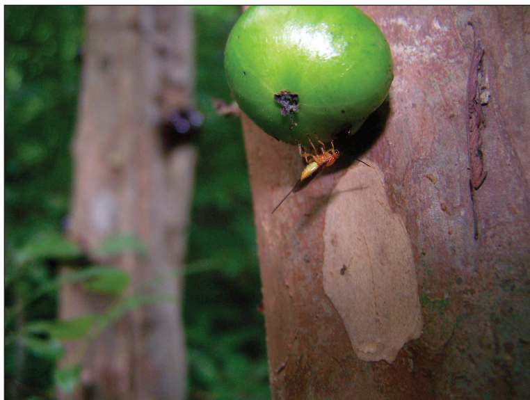
Parasitoide (Braconidae) detectando larvas de moscas de la fruta en guapurú ( Myrciaria cauliflora ).