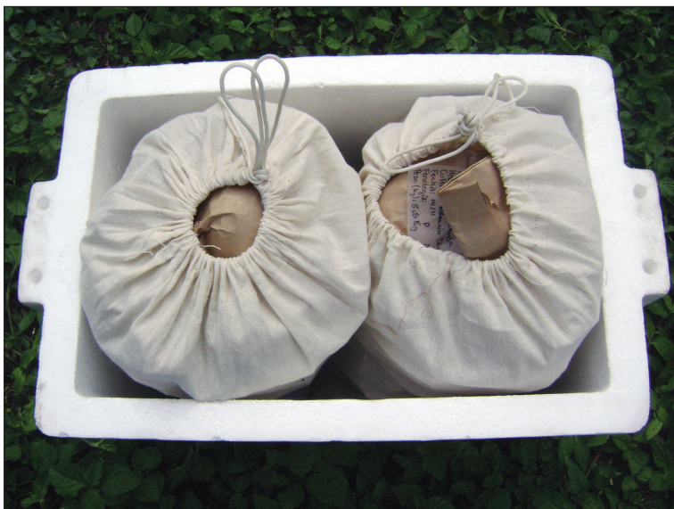
Muestras de frutas listas para ser transportadas al laboratorio.