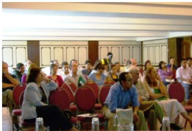
Participación en el Foro-Debate sobre Agrocombustibles: Autoridades de instituciones públicas, privadas, no gubernamentales y público en general

Una vez concluida la ronda de exposiciones, el público presente procedió a realizar las preguntas de aclaración sobre el tema a los expositores.