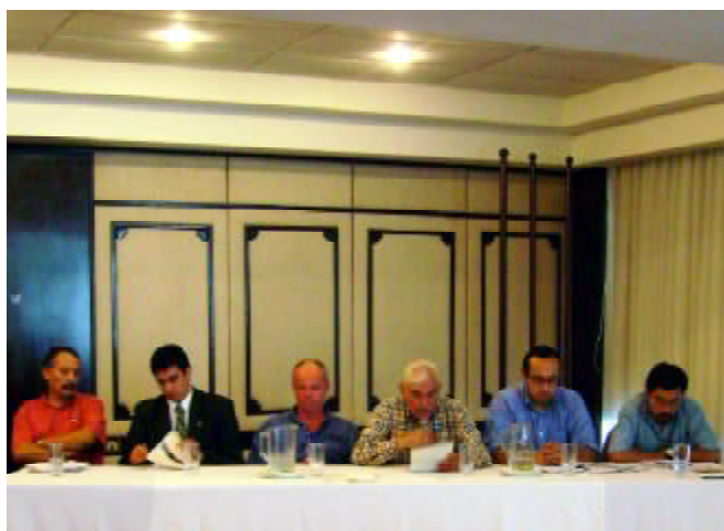
Expositores del Foro - Debate, sobre Agro-combustibles organizado por el Museo de H.N.N.K.M. y LIDEMA

III Congreso Nacional de Mastozoología realizado en EXPOCRUZ fue todo un éxito