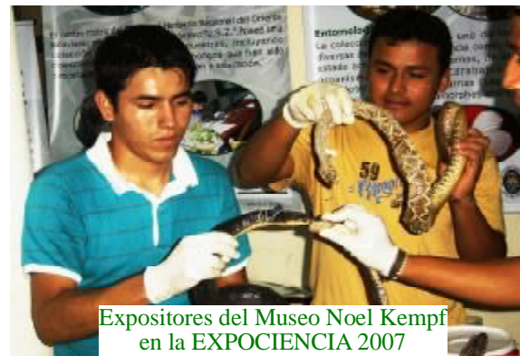
Expositores del Museo Noel Kempff en la EXPOCIENCIA 2007

En este Stand, lo que más llamó la atención a los visitantes fue la Colección de Herpetología (distintas especies de víboras disecadas en alcohol), las mismas que fueron expuestas, además los estudiantes del Museo proporcionaron información sobre el tema a los visitantes.