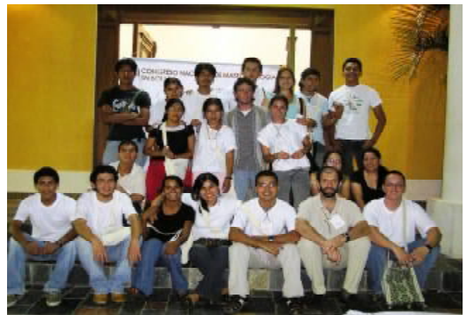
Comité organizador y de apoyo del III Congreso Nacional de Mastozoología realizado en la EXPOCRUZ