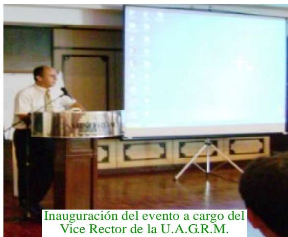
Inauguración del evento a cargo del Vice Rector de la U.A.G.R.M.