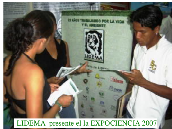
LIDEMA presente en la EXPOCIENCIA 2007