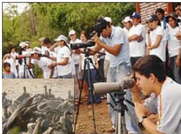
Estudiantes de la Carrera de Biología, Fac. de Cs. agrícolas, U.A.G.R.M. observando las Aves Rapaces en Consepcción