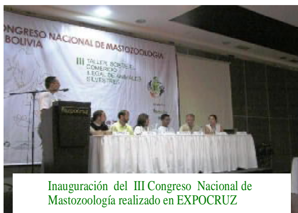
Inauguración del III Congreso Nacional de Mastozoología realizado en EXPOCRUZ

III Congreso Nacional de Mastozoología realizado en EXPOCRUZ fue todo un éxito