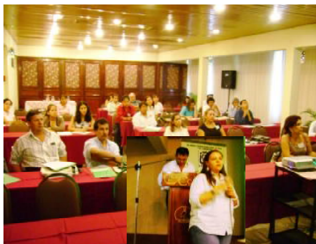
Participantes del curso de periodismo ambiental, realizado en el Hotel Cortéz - Santa Cruz de la Sierra - Bolivia.