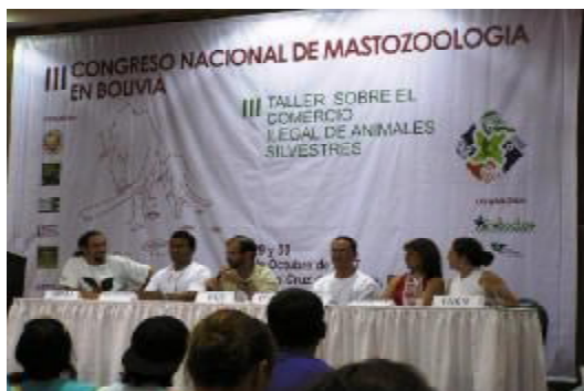
Clausura del III Congreso Nacional de Mastozoología

"Por ultimo, agradecer y resaltar que ningún logro alcanzado por el Congreso de Mastozoología hubiera sido posible sin la participación del Centro de Ecología Difusión de la Fundación Simón I. Patiño, Fundación Amigos de la Naturaleza, Fundación para la Conservación del Bosque Chiquitano, The Nature Conservancy, Asociación Boliviana para la Conservación-Trópico y la Carrera de Biología de la UAGRM, cuyo apoyo hizo posible la realización de tan importante acontecimiento científico".