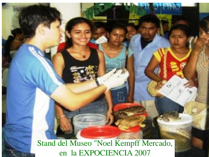
Stand del Museo "Noel Kempff Mercado, en la EXPOCIENCIA 2007

En el mismo Stand participó la Liga de Defensa del Medio Ambiente (LIDEMA), informando a los visitantes sobre las distintas actividades que viene ejecutando esta gestión, en la conservación del medio ambiente y nuestros recursos naturales.