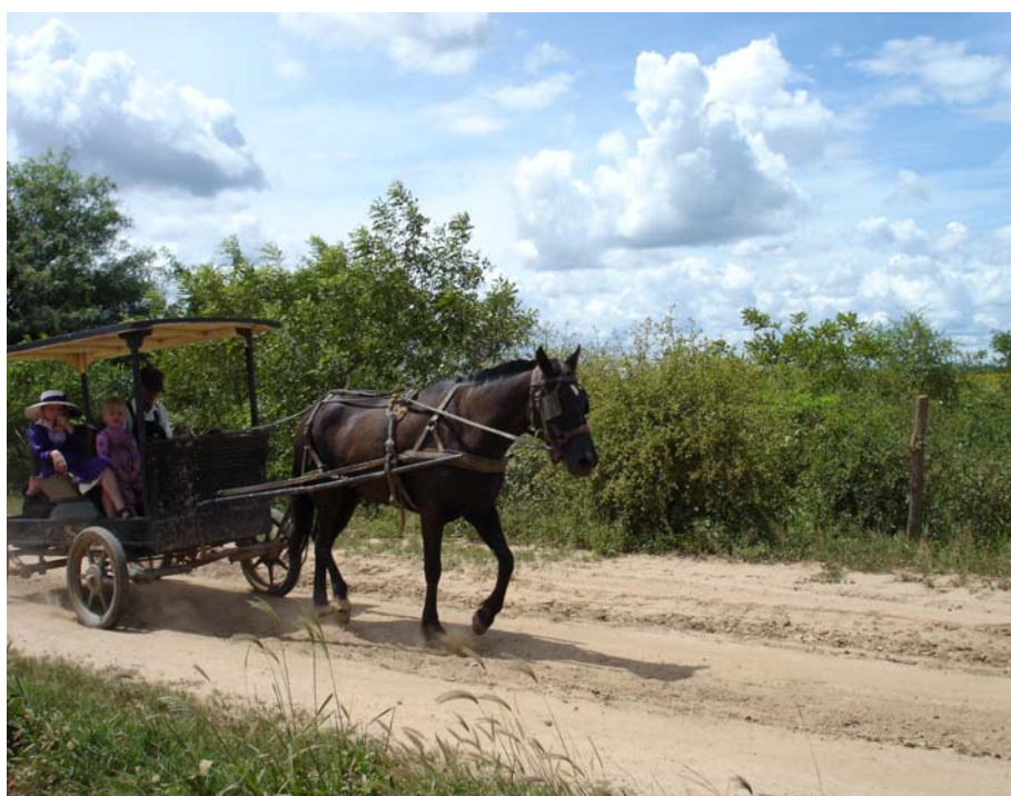
Figura 2.5 Miembros de una familia menonita

En los últimos años los menonitas se trasladan del sur al norte buscando mejores tierras con mejores condiciones productivas, ya que la baja producción debido a las pocas lluvias y niveles bajos de producción de leche obliga a los menonitas a trasladarse del sur al norte del país e incluso fuera del país en busca de mejores tierras. Otro factor que afecta a estas colonias es el poco conocimiento sobre conservación del suelo y métodos agrícolas modernos, así como las restricciones religiosas son causas frecuentes de prácticas agrícolas que limitan el crecimiento económico y ponen en peligro los recursos naturales tales como los suelos y el agua. En las colonias el sistema de elección de sus autoridades es cada dos años mediante la votación de todos los miembros de las colonias, que son todos los hombres bautizados, que van de 16 años en adelante.