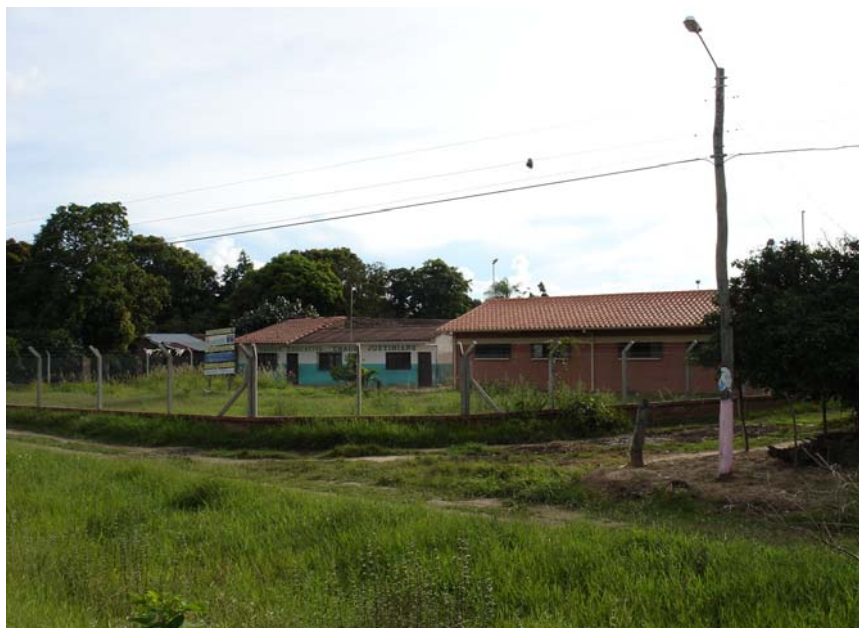
Figura 2.1 Escuela Pública en la provincia Ignacio Warnes

Tienen mayor cobertura en cuanto a infraestructura disponible ya que los centros poblados cuentan con infraestructura para atender la salud de la población. Los niveles de mortalidad infantil para este grupo son más bajos comparado con los agricultores tradicionales indígenas con una tasa de mortalidad infantil (TMI) de 41 por mil nacidos vivos para el 2001.