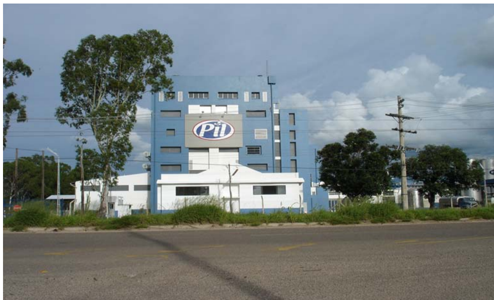
Figura 2.2. Ex Planta Industrializadora de Leche PIL en Warnes.

El grupo de los empleados de los agricultores cruceños y chaqueños, es quizás el grupo más desprotegido de la sociedad ya que no existen organizaciones que los apoyen ni sindicatos campesinos que los representen.