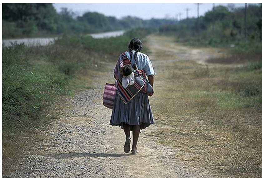
Figura 2.3 Mujer de San Julián

Las condiciones de la vivienda difieren de acuerdo a la zona (cuadro 2.5). La calidad de la vivienda es baja para la zona de los Yungas y San Julián. Es decir que las paredes de las viviendas son de tabique y el