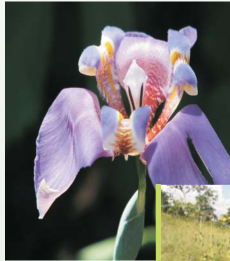
Flor de Cypella sp.

De más importancia es el número elevado de especies aparentemente nuevas para la ciencia de varias familias. Éstas incluyen una especie en el género Cypella (Iridaceae) con una flor muy llamativa pero relativamente pequeña, una especie de Viguiera (Asteraceae), una especie de Aphelandra (Acanthaceae), una especie de Pavonia (Malvaceae) y una especie de Bouteloua (Poaceae).