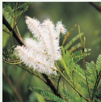
Mimosa especie nueva

otros artículos de esta revista. Otro hotspot es la transición entre vegetación del Cerrado y la del chaco en la zona de San Juan, Taperas y Roboré. Finalmente se debe enfatizar que cada vez que hemos subido a la Serranía de Caparuch hemos encontrado nuevos registros para Bolivia y nuevas especies para la ciencia. Aunque hubo muchas visitas botánicas al Parque Noel Kempff Mercado en los años 90 del siglo pasado, la meseta y sus laderas siguen siendo poco exploradas y existe buena posibilidad de encontrar numerosos registros nuevos y especies nuevas con estudios más intensivos.