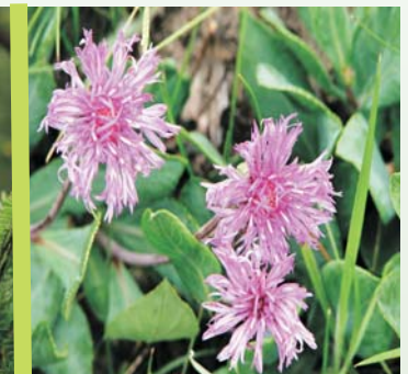
Vernonia especie nueva