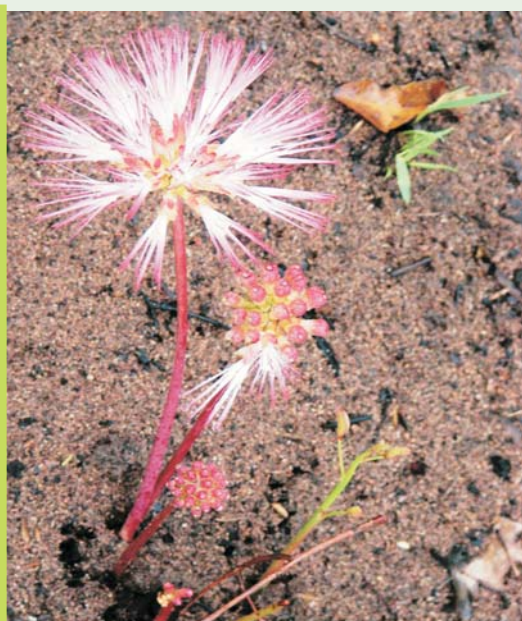
Hábito de Calliandra longipes

La zona de Rincón del Tigre, hasta hace algunos años atrás era casi desconocida botánicamente, clara prueba es que no existía en el Herbario del Oriente Boliviano (USZ) del Museo de Historia Natural "Noel Kempff Mercado" colecciones de la zona. No obstante dentro del marco del Proyecto "Darwin de los Cerrados" se realizaron algunas visitas con el fin de evaluar los Cerrados que se encuentran en la zona y coleccionar plantas representativas. Los principales tipos de vegetación son Cerrado y bosque semidecíduo con elementos del Chaco y Bosque Seco Chiquitano; pero también existen lajas y zonas de pantano. Con las investigaciones realizadas por el proyecto se logró constatar que la zona alberga muchas plantas interesantes. Entre las novedades para Bolivia se registró Cardiospermum pterocarpum , (Sapindaceae), una de las pocas especies de esta familia que crece únicamente en los Cerrados y a Calliandra longipes de la familia Leguminosae.