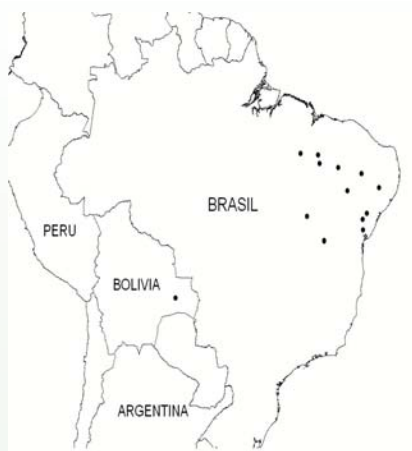
Distribución de Pityrocarpa moniliformis

En varias oportunidades la distribución de una planta produce una sorpresa. Cerca de la pequeña comunidad de Ipías entre los municipios de San José y Roboré se encuentra una población del pequeño árbol, Pityrocarpa moniliformis . Una revisión de su distribución mundial muestra algo extraño. Esta especie crece en dos lugares muy separados: la primera en la comunidad de Ipías y la segunda al noreste de Brasil, aunque recién se la ha introducido a Venezuela.