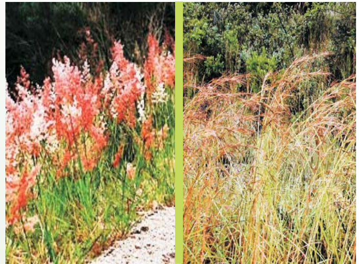
Figura 2 Pasto invasor, ( Melinis repens )