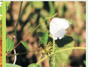
Pavonia especie nueva