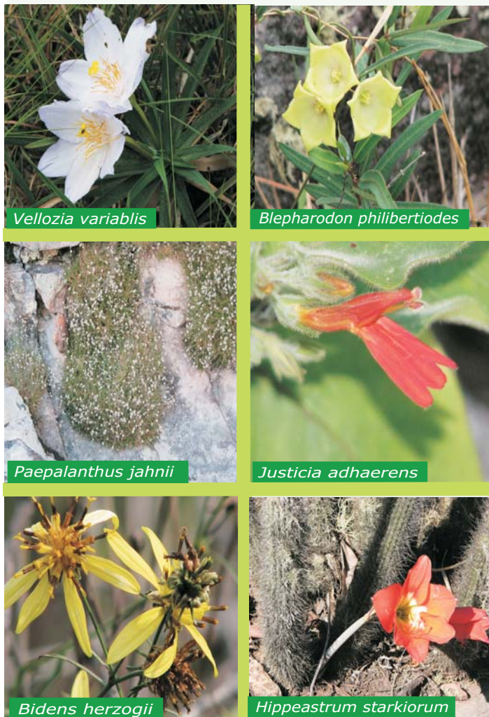
Especies típicas de campo rupestre de la zona de Chochís - Santiago de Chiquitos

Las serranías del municipio de Roboré se encuentran en la provincia de Chiquitos, al este del Departamento de Santa Cruz. Se extienden desde el oeste de Chochís pasando por Motacú hasta el este de Santiago de Chiquitos.