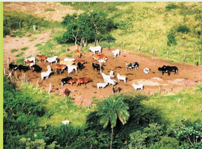
Figura 1 Ganado y sobrepastoreo en el oriente boliviano

Sin embargo, la ganadería a base de pastos introducidos a demostrado ser mucho más rentable hasta ahora. El sobre pastoreo (ver Figura 1), combinado con el ingreso de pastos introducidos como Melinis repens (ver Figura 2), Melinis minutiflora y Hyparrhenia rufa (ver Figura 3)