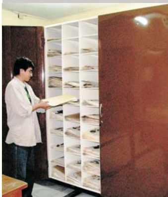
Incorporaciones de exsiccatas a los compactadores del Herbario del Oriente Boliviano (USZ) Museo de Historia Natural "Noel Kempff Mercado" Santa Cruz - Bolivia

La segunda tarea dedicada a la identificación de los especímenes con la participación de expertos nacionales e internacionales en diferentes grupos de plantas y a su vez en la capacitación de los botánicos del proyecto. La tercera tarea fue dedicada a la sistematización de la información, generando una base de datos digital en el programa BRAHMS y un banco de fotos para la mayoría de los especímenes coleccionados. Finalmente, el proyecto ha adquirido una gama de materiales para el trabajo de campo como son: cámaras fotográficas, GPS, tijeras de podar, lupas de mano y de mesa para la identificación de plantas; otros materiales para trabajo de gabinete como: dos microscopios, 30.000 hojas de cartulina del herbario, carpícola, papel Kraft, cartulina tipo manila y finalmente el proyecto ha adquirido cuatro compactadores para cuidar los especímenes a largo plazo y contribuyó significativamente al desenvolvimiento y mejora del Herbario del Oriente Boliviano del Museo de Historia Natural Noel Kempff Mercado. Sin embargo, para un adecuado uso y manejo de la información depositada en la colección científica por éste y otros proyectos todavía existe la necesidad de contar con personal de planta como por ejemplo un curador de herbario para el manejo y procesamiento de la colección (exsiccatas).