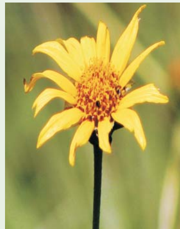
Flor de Viguiera sp.