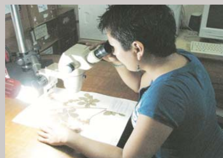
Estudio de exsiccatas con microscopio en el Herbario del Oriente Boliviano (USZ)