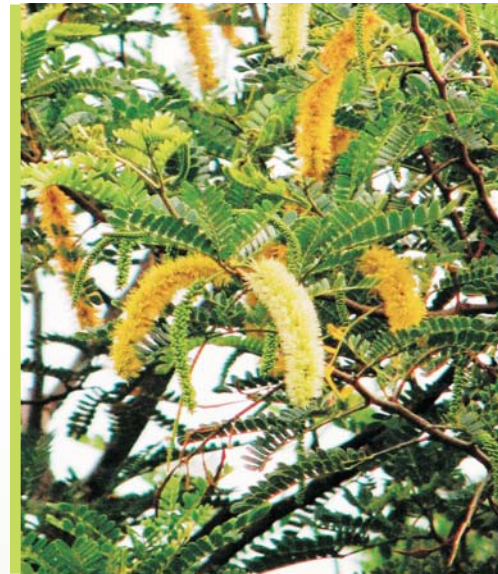
Flores y hojas de Pityrocarpa moniliformis

Parece que las tres especies relativamente raras, Pityrocarpa moniliformis , Hyptis platanifolia y Tabebuia selachidentata crecen en la transición entre el Cerrado y una vegetación de Cerrado chaco/ caatinga en dos lugares separados por unos 2500 kilómetros en los límites opuestos del Cerrado.