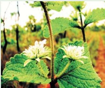
Hyptis especie nueva